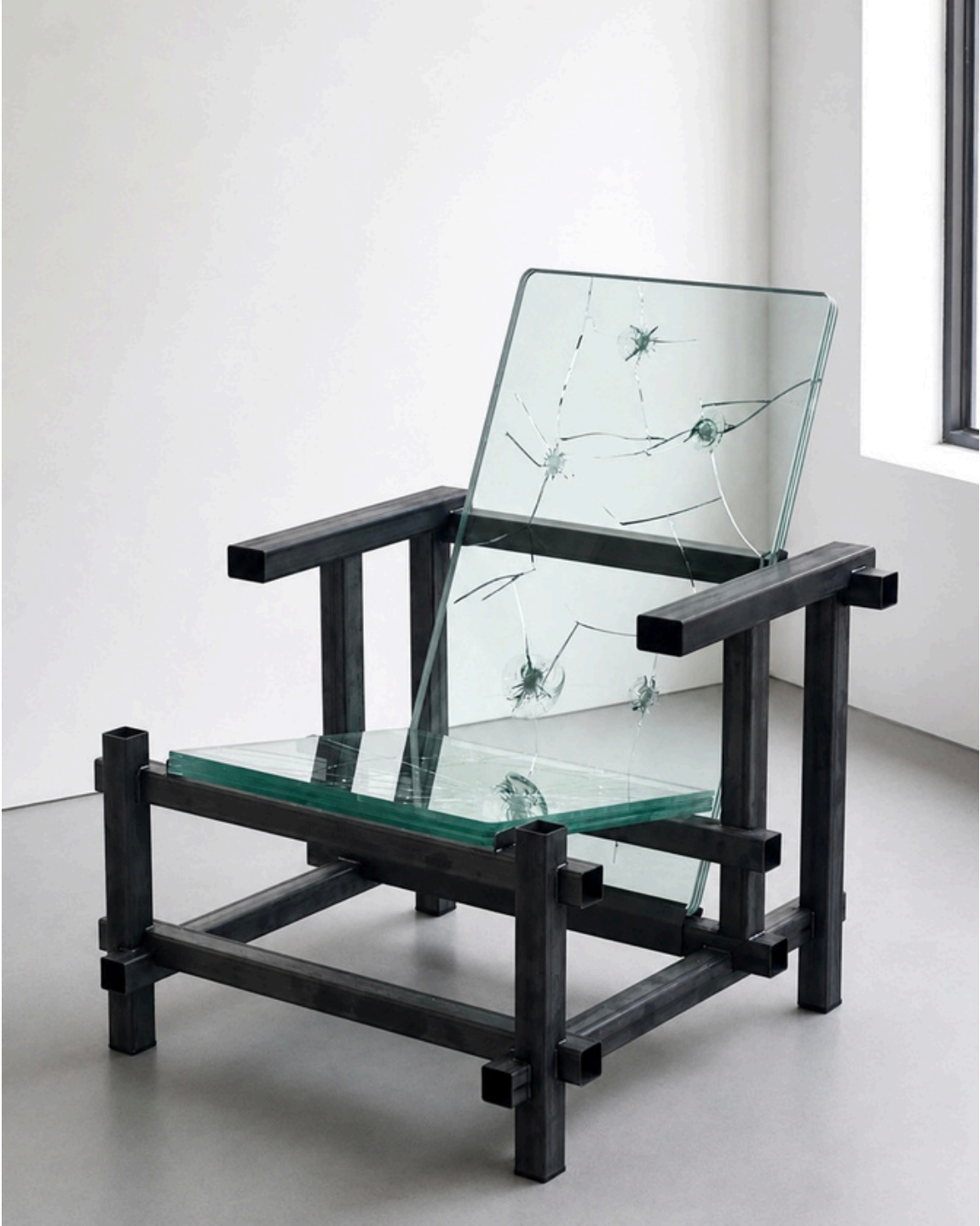
"Gerrit Rietveld'e İtafen" Kurşun geçirmez cam, Demir 83x88x65 cm 2026 6.000 $ + KDV